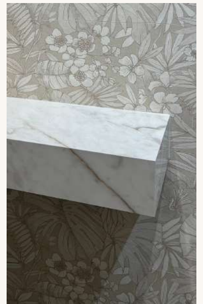
rezanje na gerung